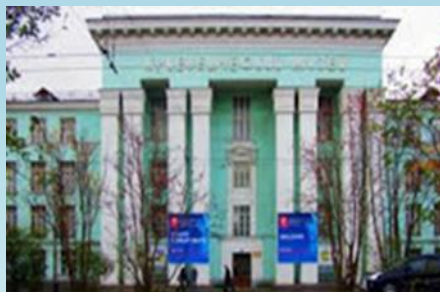
Мурманский областной краеведческий музей, Проспект Ленина, 90