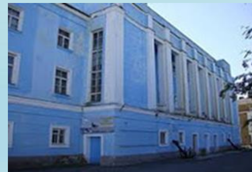
Военно –морской музей Северного флота, улица Володарского, 6