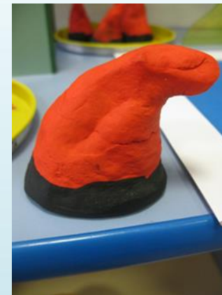
Украинский головной убор со шлыком