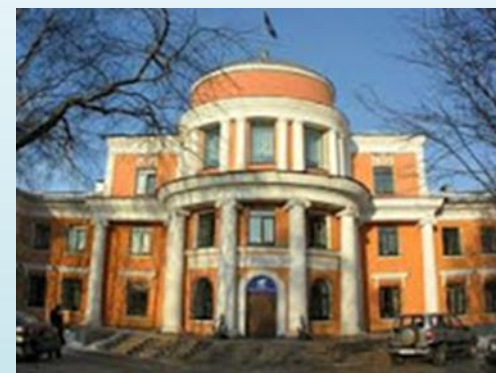
Музей истории Мурманского морского пароходства, улица Торцева, 15