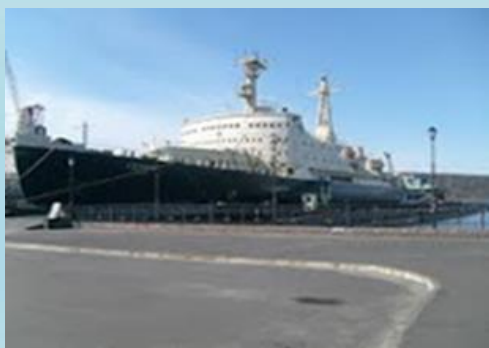
Атомный ледокол Ленин, проезд Портовый, 25