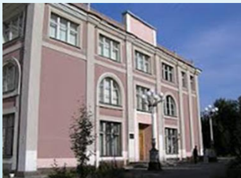
Мурманский областной художественный музей, улица Коминтерна, 13

Музей – это мощная река жизни, которая пробуждает лучшие мысли и чувства своих посетителей через уроки мужества, экскурсии, встречи и праздники.